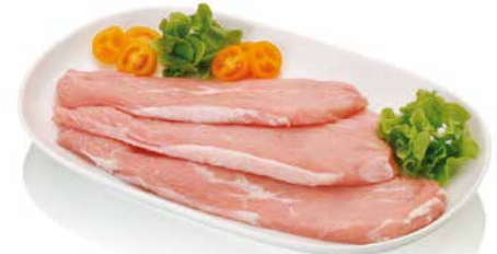
▪ Filetes de ternera blanca de 1ª.