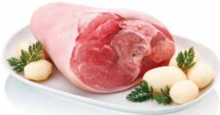
▪ Codillo sazonado