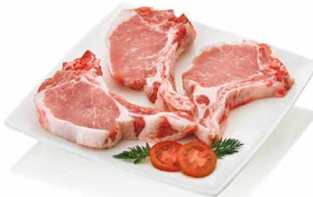
▪ Chuletas de cerdo ibérico