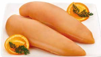
▪ Filetes de pechuga de pollo de corral