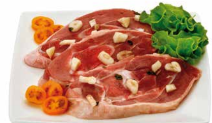
▪ Chuletas de pavo al ajillo